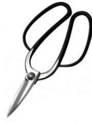
U-04 花吹雪 津島型 1 号 全長 230mm/重量 280g 青紙鋼