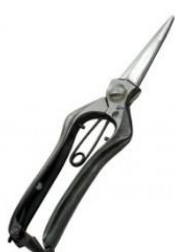
S-26 工藤製鋏所両刃芽切鋏長刃 全長 6,500mm/重量 290g 炭素鋼