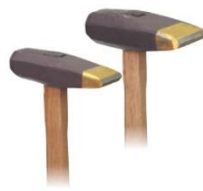
山形コヤスケ 柄付 10×50mm 8×40mm