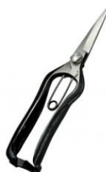
S-11 飛庄 両刃芽切鋏平刃 全長 200mm/重量 170g SK-5