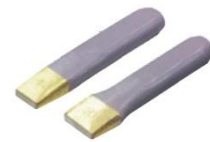
端切り(鉄平用) 5分平台 4×15 幅 5分平台 4×20 幅