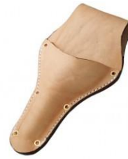
C-05 本職植木鋏用(台曲) H280mm×Wmm150 ※特厚革銅鋏