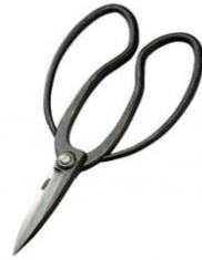
U-03 花吹雪 庭師用 C 型 全長 215mm/重量 290g 青紙鋼