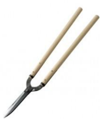
K-03 花吹雪 門型刈込鋏 180mm 全長 765mm 刃長 185mm 重量 1070g 柄:樫 青紙鋼