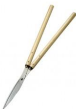
K-16 花吹雪 東方型刈込鋏反刃 195mm※薄刃総磨仕上 全長 730mm 刃長 200mm 重量 620g 柄:朴 黄紙鋼