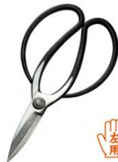
U-18 花吹雪庭師用 A 型左用 全長 210mm/重量 240g 白紙鋼