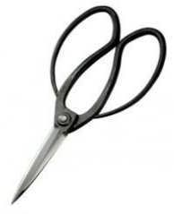
U-05 花吹雪伊吹刈 3.5 寸刃 全長 230mm/重量 230g 青紙鋼