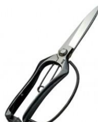
S-15 飛庄 松葉切鋏(足輪付) 全長 230mm/重量 240g S60C