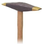
刃ピシャン 柄付き 4刃/5刃