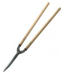
K-02 花吹雪 京型刈込鋏 195mm 全長 815mm 刃長 200mm 重量 910g 柄:樫 黄紙鋼