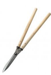
K-10 花吹雪 止無刈込鋏 195mm 全長 705mm 刃長 200mm 重量 940g 柄:樫 白紙鋼