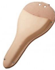
C-03 4寸/5寸刃用植木鋏用 H300mm×W145mm