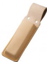
C-61 折込鋸用(台曲小) H250mm×W70mm