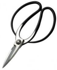
U-01 花吹雪 庭師用 A 型 全長 210mm/重量 250g 青紙鋼