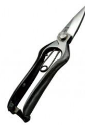
S-24 工藤製鋏所 剪定芽切鋏 全長 190mm/重量 180g 炭素鋼