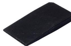
板矢 小 6厚×60L×30 幅 中 12厚×80L×40 幅 大 14厚×90L×50 幅