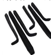
セリ矢 φ14.5 φ16 φ22