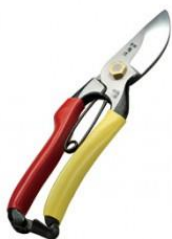
S-05 飛庄 剪定鋏 SR-1 全長 195mm/重量 250g YCS-3