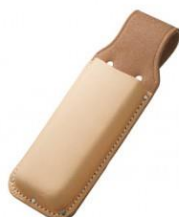
C-62 折込鋸用(台曲台) H265mm×W90mm