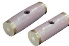
超硬玄能 φ50 3.0kg φ58 3.5kg