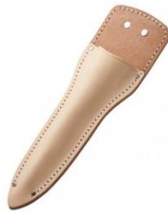
C-112 片手刈込(根切)鋇用 H290mm×W86mm