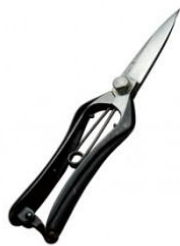
S-29 吾妻川 両刃芽切鋏 全長 200mm/重量 200g 炭素鋼