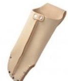
C-35 剪定鋏用(台曲筒型大) H230mm×W80mm