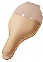
C-01 植木鋏用(台曲) H265mm×W135mm