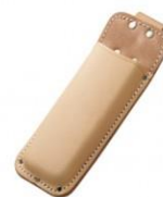
C-65 折込鋸用 H230mm×W80mm