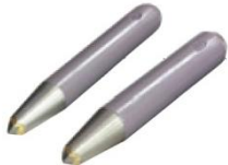
ハツリノミ φ27(穴埋込) φ30(穴埋込)