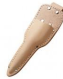
C-101 芽切鋇用 H220mm×W85mm