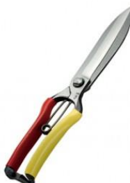
S-17 飛庄 片手刈込鋏両刃(反刃) 全長 270mm/重量 290g SK-7