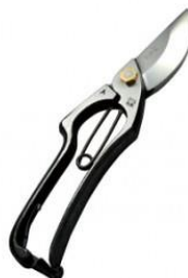
S-07 飛庄 剪定鋏 A 型 9 吋 全長 230mm/重量 400g YCS-3