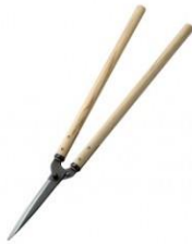
K-18 花吹雪 止付刈込鋏 195mm 全長 750mm 刃長 195mm 重量 960g 柄:樫 SK-5