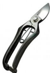
S-02 花吹雪 剪定鋏 S 型 全長 200mm/重量 260g YCS-3