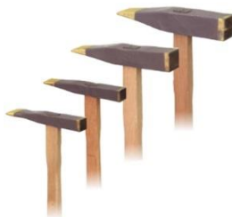
トンカチ(ストレート型)両刃柄付き 6口/18幅 16口/25幅 25口/25幅 30口/30幅