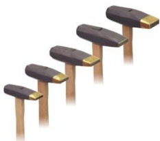
コヤスケ 柄付 No1 12×40mm No2 10×40mm(埋込) No5 8×40mm No7 8×35mm No8 6×30mm