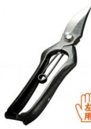
S-23 工藤製鋏所 剪定鋏 左刃 全長 205mm/重量 240g 炭素鋼