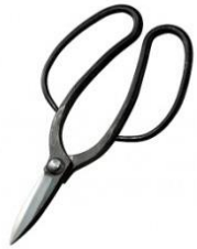
U-06 花吹雪 京型 1 号 全長 220mm/重量 280g 青紙鋼