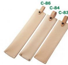
C-83 刈込鋇用角型 H240mm×W70mm