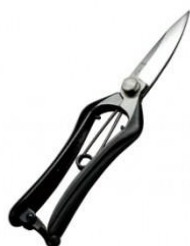
S-30 吾妻川 片刃芽切鋏 全長 205mm/重量 210g 炭素鋼