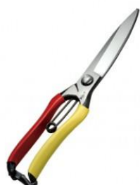
S-19 飛庄 片手刈込鋏片刃 全長 270mm/重量 300g SK-7