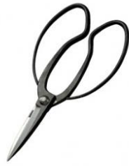
U-02 花吹雪 庭師用 B 型 全長 218mm/重量 210g 青紙鋼