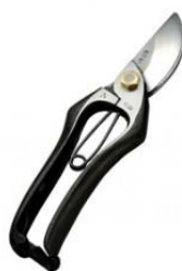
S-03 花吹雪 剪定鋏 A 型 全長 200mm/重量 270g S58C