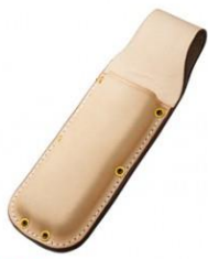
C-67 本職用折込鋸用(台曲) H270mm×W90mm ※特厚革銅鉾