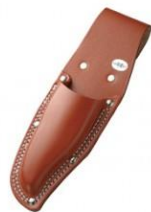
C-37 剪定鋏用(台曲アクリル加工) H260mm×W85mm ※防水アクリル加工