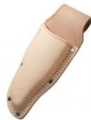
C-32 剪定鋏用大(台曲2重縫) H240mm×W90mm