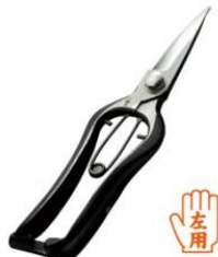
S-14 飛庄 剪定芽切鋏長刃 全長 205mm/重量 200g SK-5