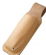
C-63 折込鋸、剪定鋏2段(台曲) H270mm×W95mm