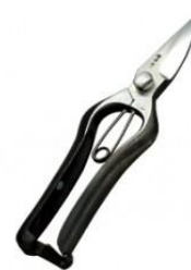
S-04 花吹雪 片刃芽切鋏 全長 190mm/重量 180g S58C