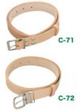
C-71 作業用ベルト H1110mm×W36mm