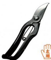
S-13 飛庄 剪定鋏左利き用 全長 200mm/重量 230g SK-5