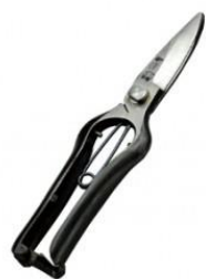
S-25 工藤製鋏所剪定芽切鋏長刃 全長 200mm/重量 190g 炭素鋼