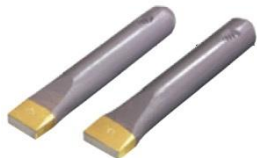
端切り(花崗岩用) φ8分 8×25 幅 φ8分 8×30 幅