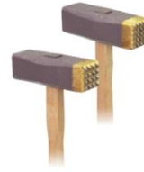
ピシャン(片刃)柄付 4×4 16刃 5×5 25刃