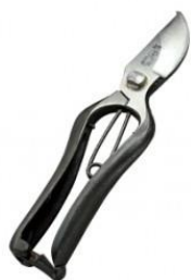
S-21 工藤製鋏所 剪定鋏 B 型 全長 205mm/重量 240g 炭素鋼