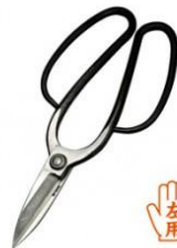
U-19 花吹雪津島型 1 号左用 全長 230mm/重量 270g 白紙鋼