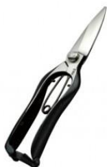
S-09 飛庄 剪定芽切鋏長刃 全長 205mm/重量 190g SK-5