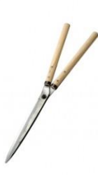
K-11 花吹雪 止無刈込鋏 300mm 全長 655mm 刃長 305mm 重量 970g 柄:樫 白紙鋼