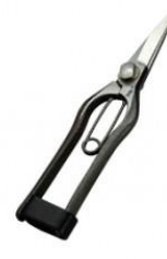
S-20 飛庄 ミニ松葉鋏 全長 163mm/重量 105g S60C