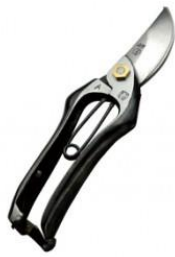
S-22 工藤製鋏所 剪定鋏 A 型 全長 205mm/重量 290g 炭素鋼