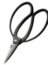
U-13 花吹雪 大久保長刃 全長 200mm/重量 230g 青紙鋼