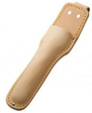
C-102 片手刈込(根切)鋇用 H275mm×W80mm