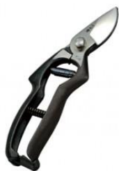
S-01 花吹雪 剪定鋏 NS 型 全長 195mm/重量 260g YCS-3