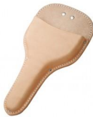
C-11 4寸刃植木鋏用 H290mm×W150mm