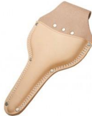
C-13 松葉鋏用(台曲2重縫) H310mm×W160mm