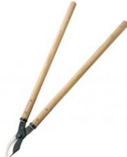
K-19 花吹雪 太枝切鋏(株切) 全長 760mm 刃長 100mm 重量 1200g 柄:樫 SK-5