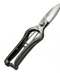
S-28 工藤製鋏所 両刃根切鋏 全長 205mm/重量 210g KA70 SK7 等