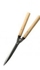
K-12 花吹雪 止式刈込鋏 240mm 全長 625mm 刃長 245mm 重量 1010g 柄:樫 黄紙鋼