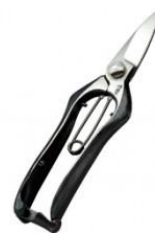
S-08 飛庄 剪定芽切鋏 全長 185mm/重量 170g SK-5