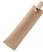
C-90 刈込鋇用角型(布皮) H240mm×W70mm