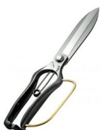
S-18 飛庄片手刈込鋏両刃(足輪付) 全長 270mm/重量 295g SK-7