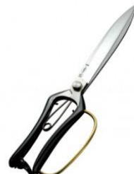
S-32 吾妻川 軽量片手刈込 鋏リング付 全長 285mm/重量 280g 炭素鋼