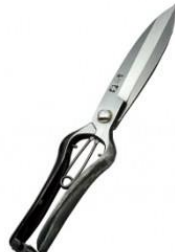
S-27 工藤製鋏所 片手刈込鋏 左刃 全長 270mm/重量 300g KA70 SK7 等