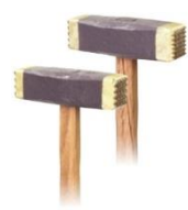
ピシャン(両刃)柄付 16刃/25刃 25刃/49刃