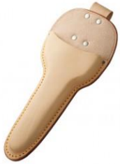
C-103 片手刈込鋇足輪付用 H290mm×W130mm