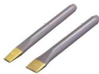
平ノミ φ5分 3×12 幅 φ6分 4×25 幅