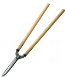
K-08 花吹雪 鉋目門型刈込鋏 210mm 全長 860mm 刃長 210mm 重量 960g 柄:栗 白紙鋼