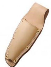
C-40 本職用剪定鋏用(台曲2重縫) H260mm×W95mm ※特厚皮銅鋏