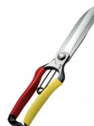
S-16 飛庄 片手刈込鋏両刃 全長 270mm/重量 290g SK-7