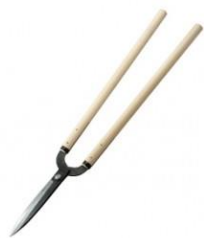
K-01 花吹雪 門型刈込鋏 195mm 全長 815mm 刃長 200mm 重量 780g 柄:朴 SK-5