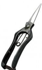
S-10 飛庄 両刃芽切鋏長刃 全長 200mm/重量 190g SK-5