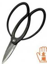
U-17 花吹雪大久保長刃左用 全長 200mm/重量 228g 黄紙鋼