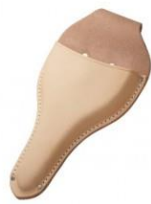
C-02 植木鋏用(台曲) H260mm×W145mm