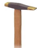
鉄平トンカチ両刃 柄付き 8×18-18幅 10×20-20幅