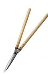
K-13 花吹雪 庭師用刈込鋏 195mm 全長 690mm 刃長 195mm 重量 900g 柄:樫 白紙鋼