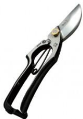
S-06 飛庄 剪定鋏 A 型 全長 200mm/重量 240g YCS-3