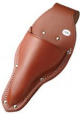
C-10 植木鋏用(台曲アクリル加工) H280mm×W130mm ※防水アクリル加工