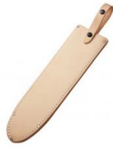
C-82 本職用刈込鋇用 H270mm×W75mm