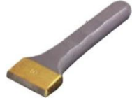
刃付端切り 平台 10×50