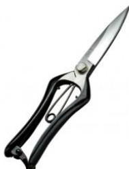
S-31 吾妻川 片刃芽切鋏 長刃 全長 230mm/重量 230g 炭素鋼