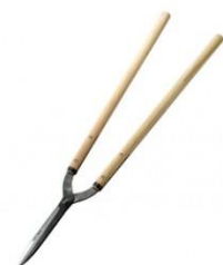
K-05 花吹雪 西型刈込鋏 180mm 全長 770mm 刃長 185mm 重量 940g 柄:樫 青紙鋼