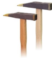
トンカチ(ケイシャ型)両刃柄付き 19口/20幅 22口/22幅