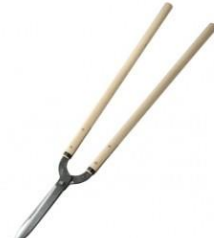
K-04 花吹雪 門型刈込鋏 210mm 全長 880mm 刃長 215mm 重量 1220g 柄:樫 青紙鋼