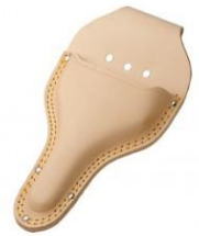
C-06 植木鋏用(台曲滑皮2重縫) H270mm×W150mm