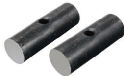
鋼玄能 φ55 3.0kg φ66 3.5kg