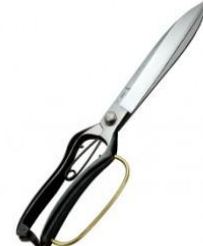
S-33 吾妻川 片手刈込鋏 リング付 全長 320mm/重量 380g 炭素鋼