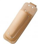
C-66 折込鋸、剪定鋏2段 H230mm×W85mm