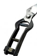
S-12 飛庄 飛鳥型 全長 195mm/重量 230g YCS-3