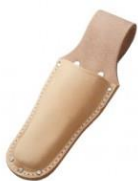
C-36 剪定鋏/ミゼットカッター用 (台曲)H230mm× W85mm